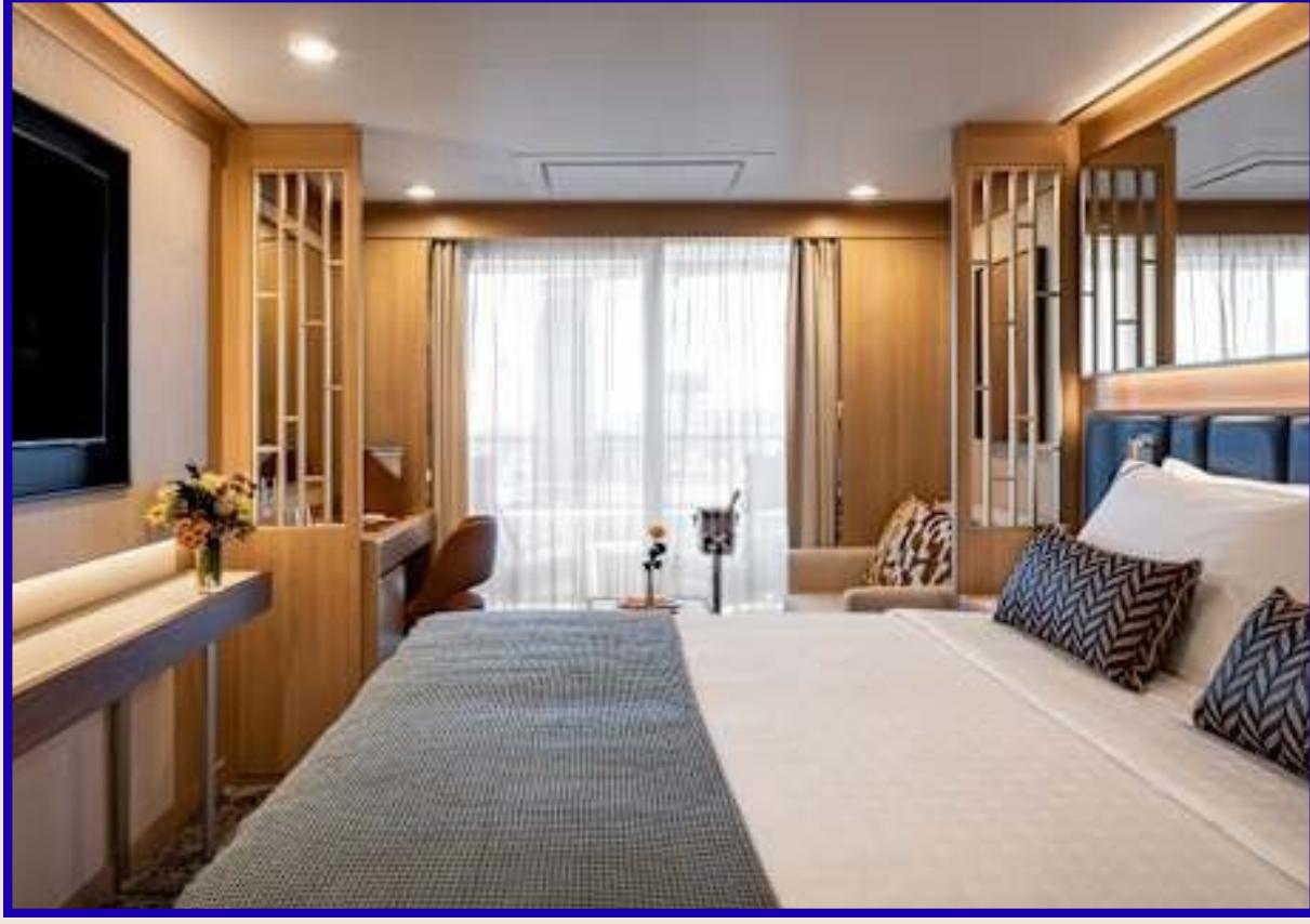
Balkonlu Suit Kabin