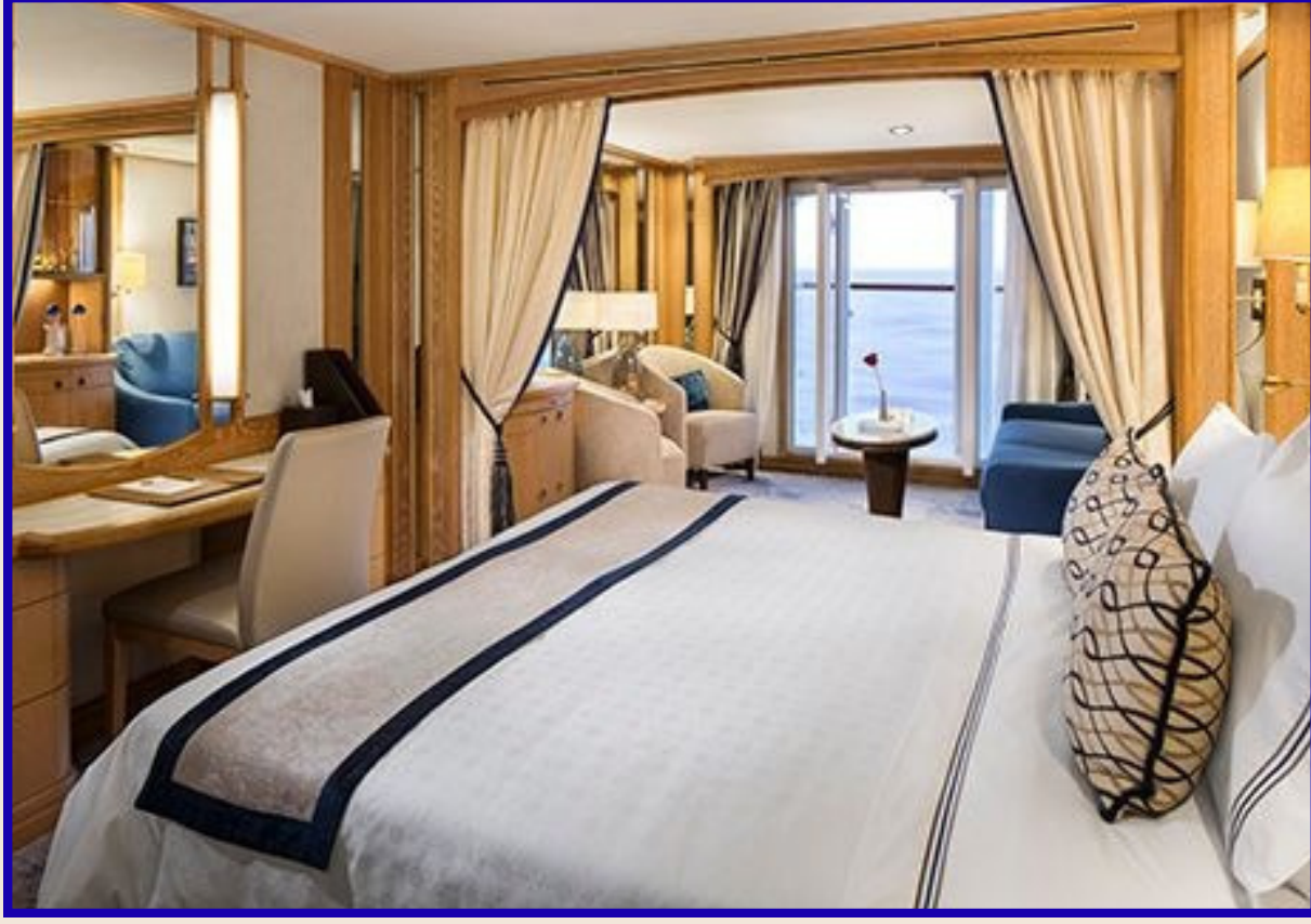
Balkonlu Suit Kabin