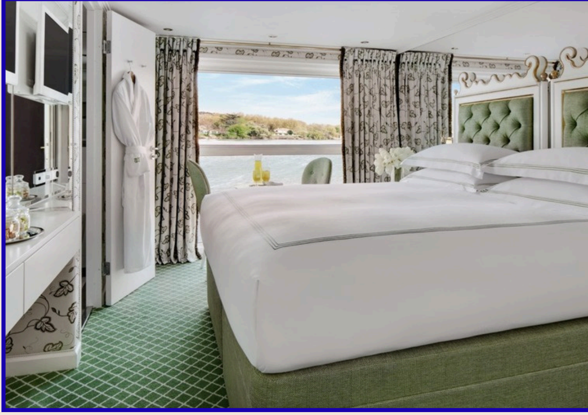
Fransız Balkonlu Kabin