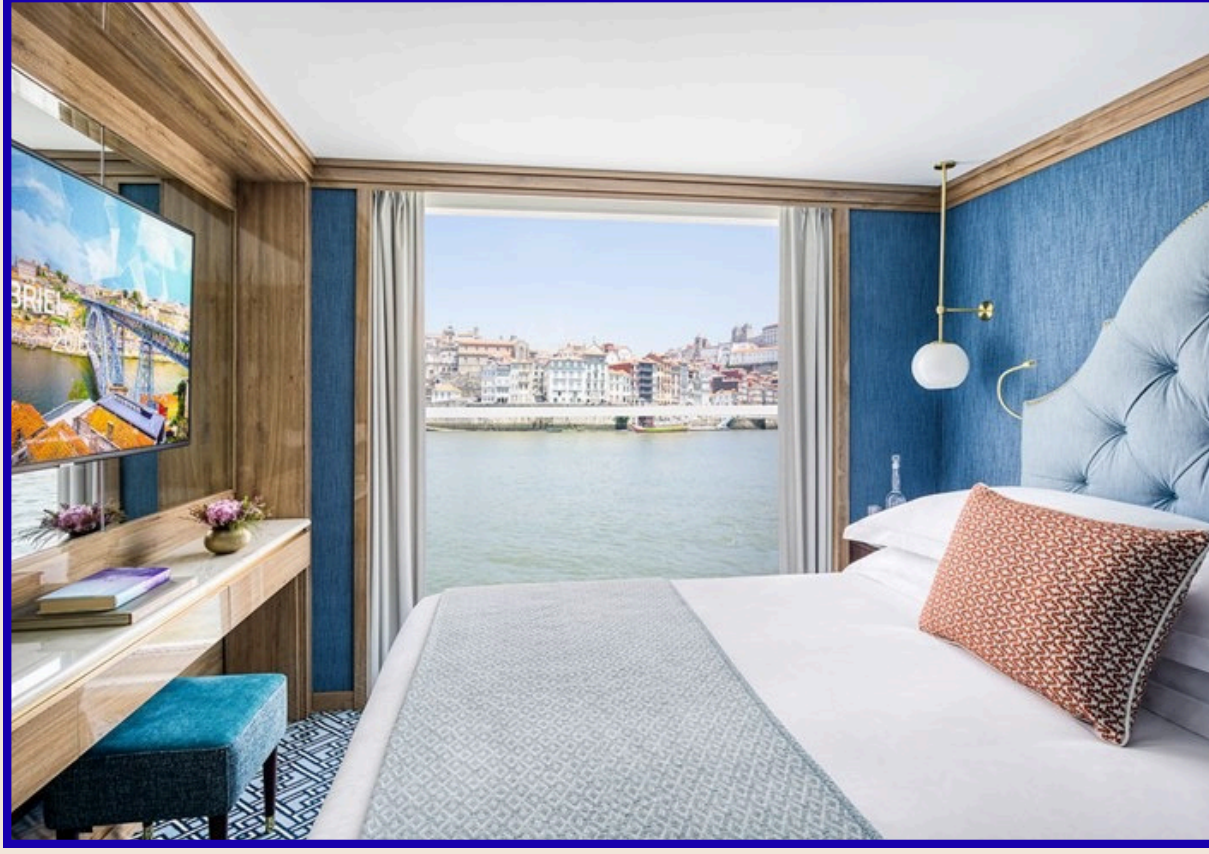
Fransız Balkonlu Kabin