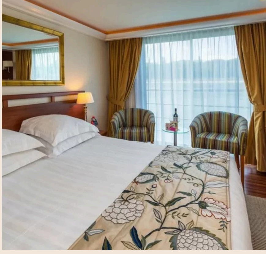
Fransız Balkonlu Kabin