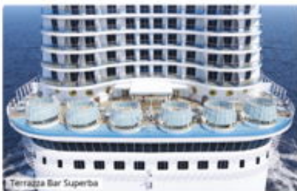
Terrazza Bar Superba