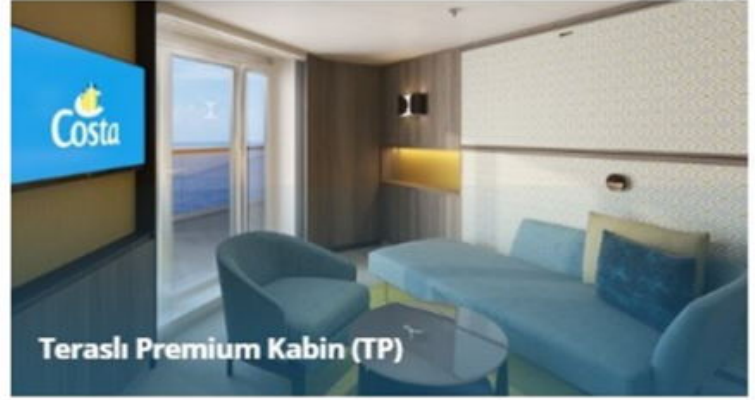
Teraslı Premium Kabin (TP)

Not: Sigara içilmesi kabinlerde yasaktır, ancak kül tablaları kullanılması durumunda balkonlarda izin verilir.