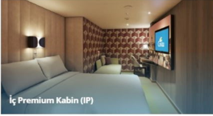
İ Premium Kabin (IP)