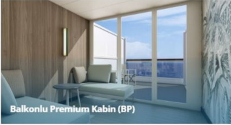
Balkonlu Premium Kabin (BP)

Not: Sigara içilmesi kabinlerde yasaktır, ancak kül tablaları kullanılması durumunda balkonlarda izin verilir.